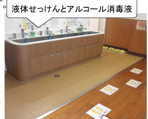
液体せっけんとアルコール消毒液