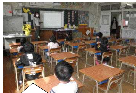
ちょっぴり緊張気味の1年生の学級開き