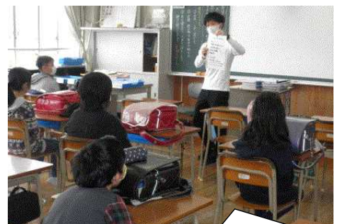
手洗いの仕方について話し合う6年生